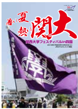
A4・8ページフルカラー

ご希望の校友は住所氏名電話番号卒年を左記連絡先までお知らせ下さい。メールアドレスにてお送り致します。