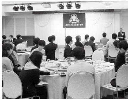
高知支部総会(高知会館にて)

母校創立150年に向け、絆を結集するよう激励があった。高知支部は平成と昭和の卒業生が半数ずつで幹事を運営しており、若さと熱い関大愛をいだいた。